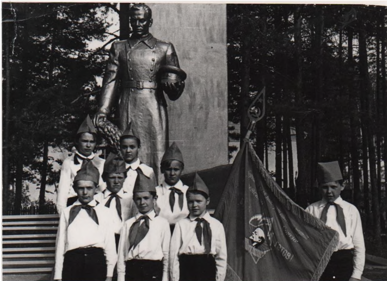
У развернутого знамени