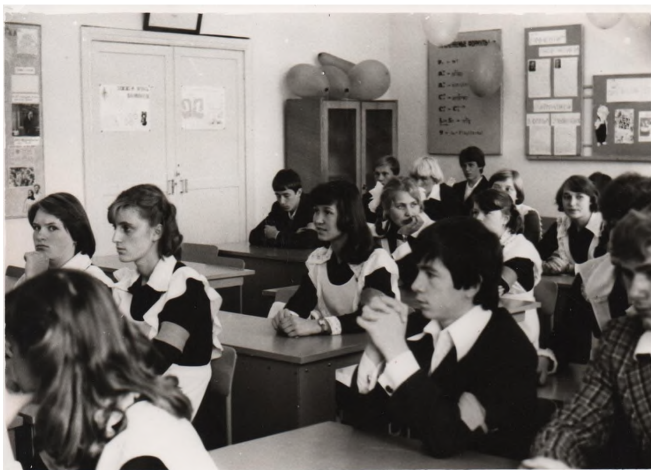
В кабинете математики