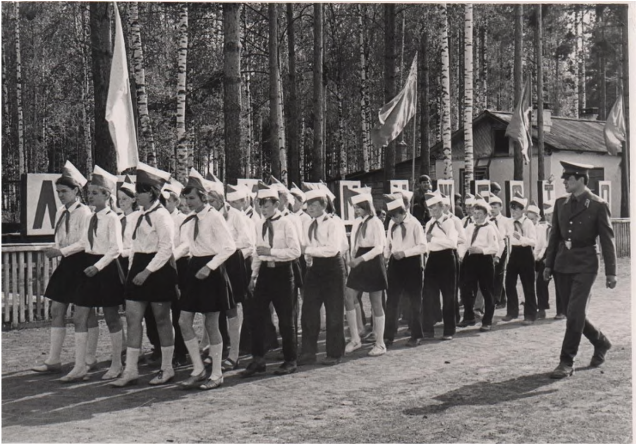
Смотр строя и песни