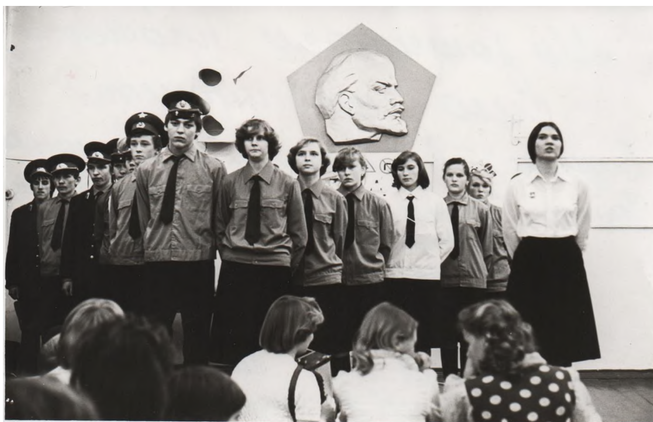
Вечер защиты профессий