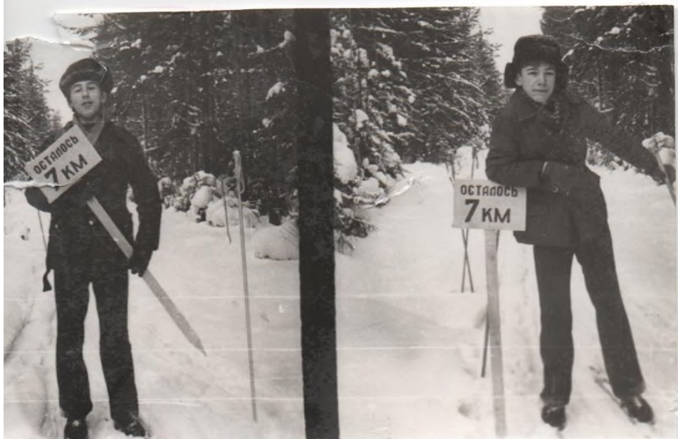
Из школьной жизни класса