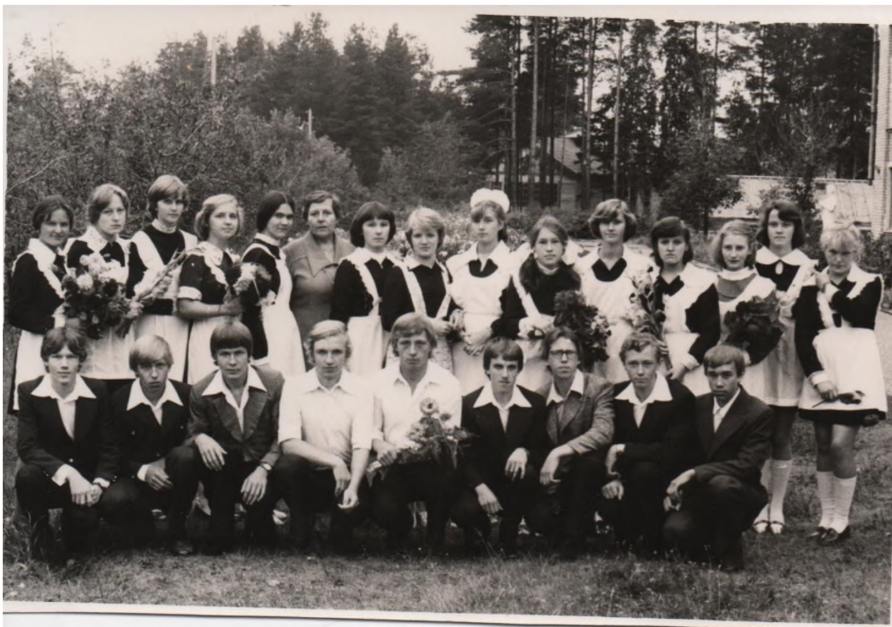
1 сентября 1979 год